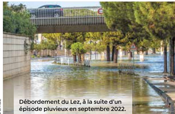
Débordement du Lez, à la suite d'un épisode pluvieux en septembre 2022.

La deuxième édition de la journée nationale Tous résilients face aux risques se déroule le 13 octobre. À Montpellier, la Ville réunit tous les partenaires de la prévention et de la gestion des risques du territoire au sein d'un village de la prévention ouvert au public, dans le quartier Centre, place du Nombre d'Or. De 9h à 18h, les Montpelliérains, à partir de 9 ans, pourront venir apprendre à mieux se protéger des risques climatiques auxquels ils peuvent être confrontés dans leur ville : orages-pluie-inondations, canicule-sécheresse et feux de forêt... au travers d'animations ludiques et pédagogiques (énigmes, jeux, quiz, casques de réalité virtuelle, mises en situation, ateliers...). En partenariat avec l'Académie de Montpellier, les classes de CM1/CM2 des écoles du quartier Centre et des bassins à risques ont été conviées à participer au village. Plusieurs centaines d'enfants y sont attendus.