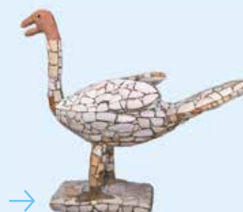
→ Charles, sculpture mixte (béton et céramique) de Nek Chand, 1980