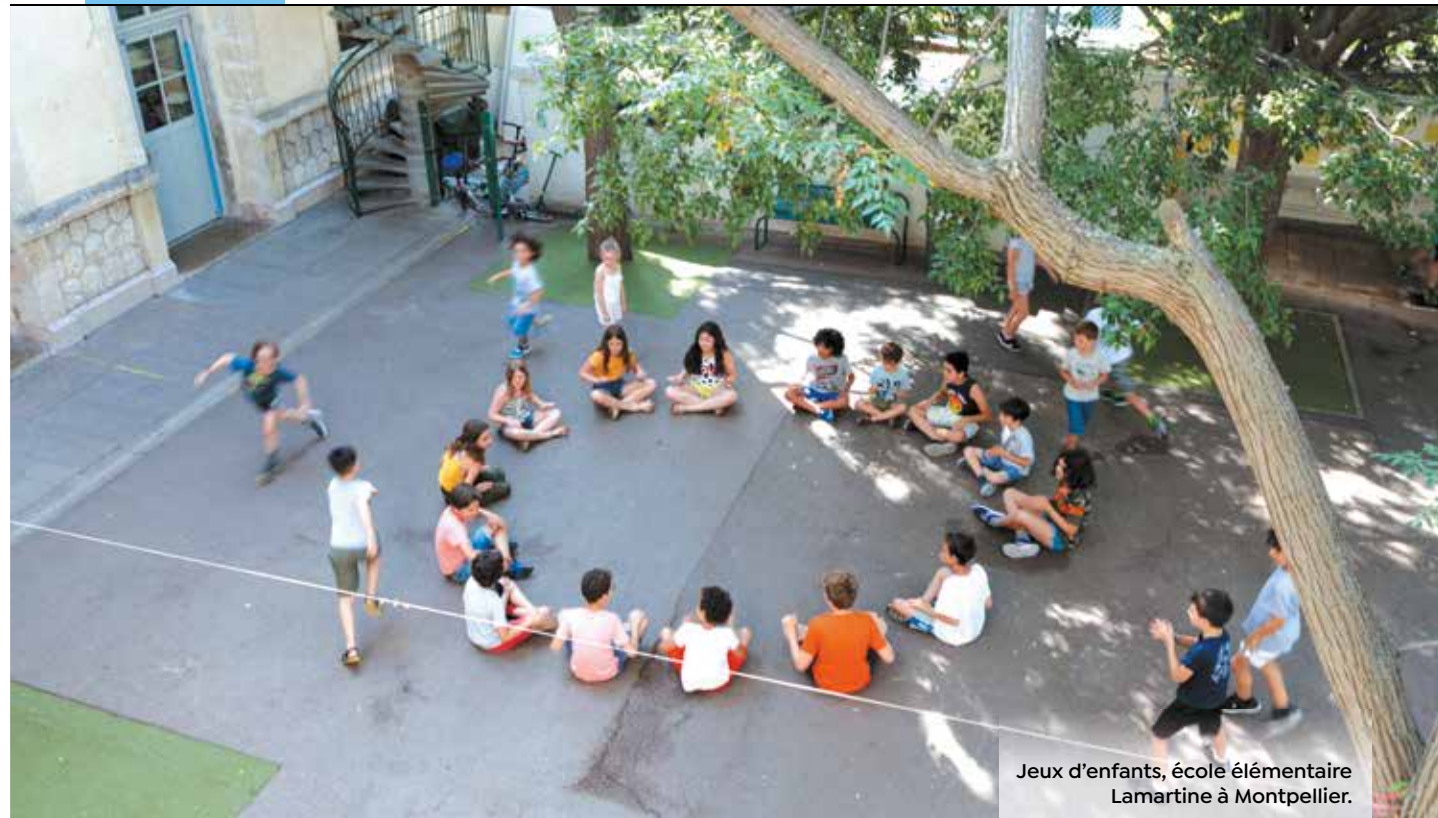
Jeux d'enfants, école élémentaire Lamartine à Montpellier.