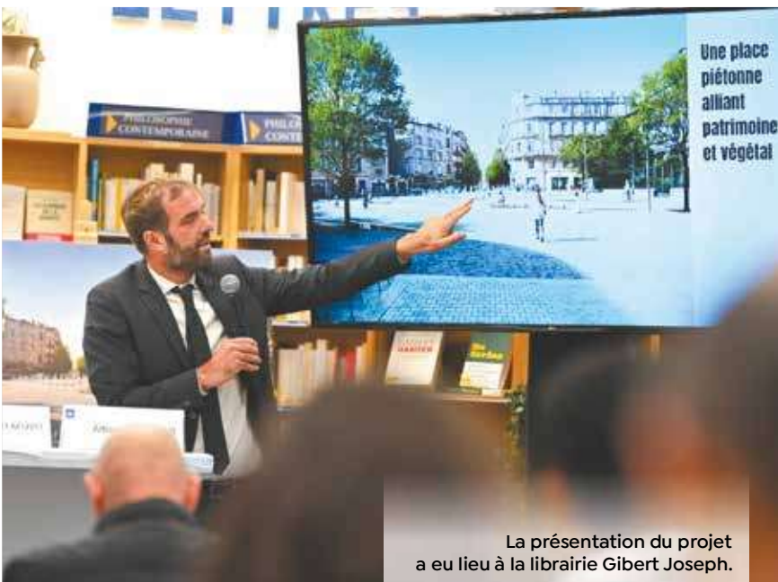
La présentation du projet a eu lieu à la librairie Gibert Joseph.