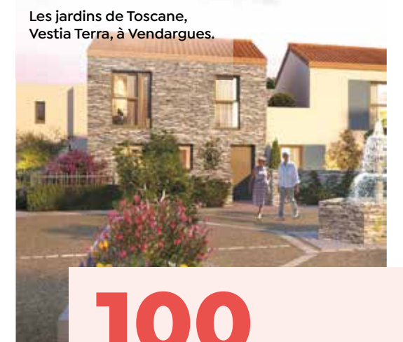
Les jardins de Toscane, Vestia Terra, à Vendargues.