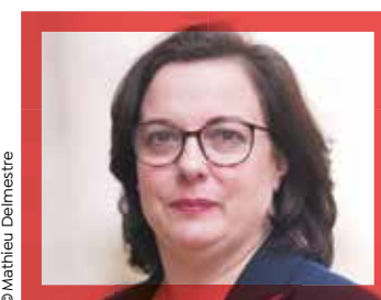
Emmanuelle Cosse, présidente de l'Union sociale pour l'habitat, organisatrice du Congrès.

20 000 congressistes en trois jours. Du 24 au 26 septembre, Montpellier accueille la 84 e édition du Congrès HLM, l'événement annuel du secteur HLM. Il rassemble les décideurs des organismes HLM de toute la France autour de réflexions sur les grandes orientations et priorités d'actions pour le secteur du logement. Trois questions à Emmanuelle Cosse, présidente de l'Union sociale pour l'habitat, organisatrice du Congrès.