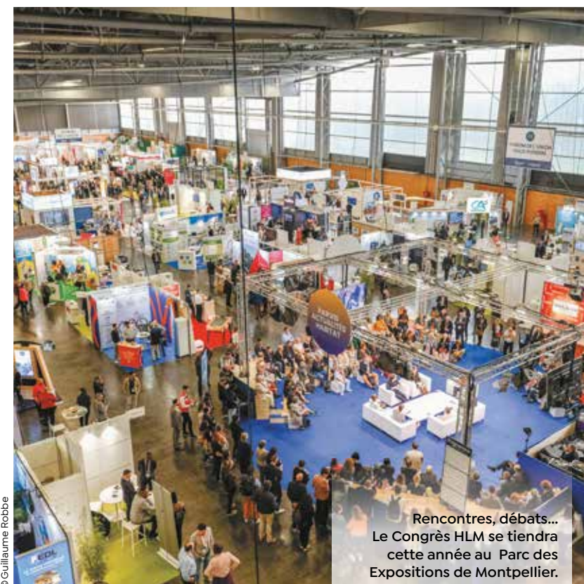
Rencontres, débats... Le Congrès HLM se tiendra cette année au Parc des Expositions de Montpellier.