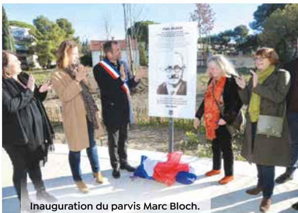
Inauguration du parvis Marc Bloch.