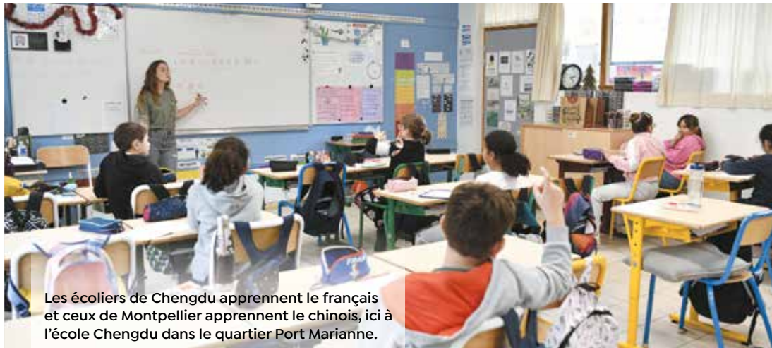
Les écoliers de Chengdu apprennent le français et ceux de Montpellier apprennent le chinois, ici à l'école Chengdu dans le quartier Port Marianne.

Une délégation conduite par le maire de Montpellier s'est rendue à Chengdu dans le cadre de son jumelage. Occasion de faire le point sur l'enseignement du chinois. À Montpellier, il est possible d'apprendre la langue de Confucius de l'élémentaire à l'université.