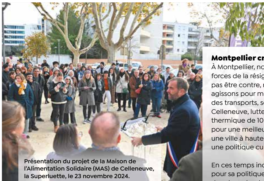
Présentation du projet de la Maison de l'Alimentation Solidaire (MAS) de Celleneuve, la Superluette, le 23 novembre 2024.