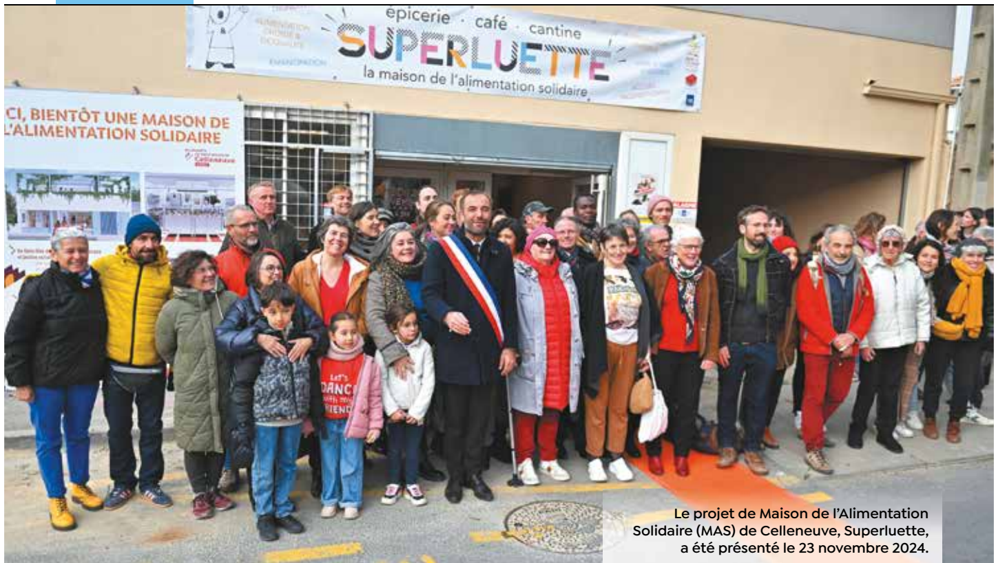
Le projet de Maison de l'Alimentation Solidaire (MAS) de Celleneuve, Superluette, a été présenté le 23 novembre 2024.