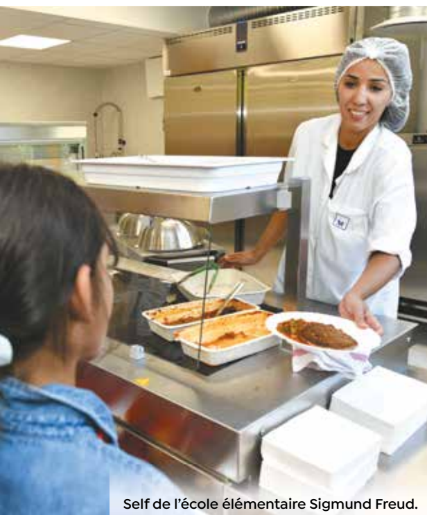
Self de l'école élémentaire Sigmund Freud.

La création de la Cité de l'alimentation, qui aboutira à horizon 2028, permettra de répondre à la demande croissante des cantines.