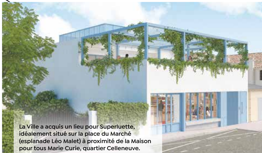
La Ville a acquis un lieu pour Superluette, idéalement situé sur la place du Marché (esplanade Léo Malet) à proximité de la Maison pour tous Marie Curie, quartier Celleneuve.

Comme en témoignent : le réaménagement du pôle de transformation du Marché Gare (voir p. 24-25 Montpellier Métropole En Commun) ; « La Déclaration de Montpel-