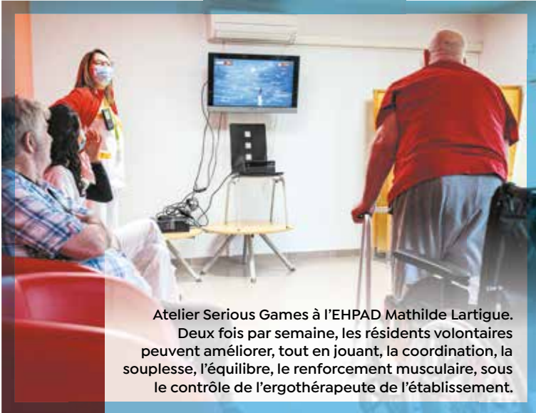
Atelier Serious Games à l'EHPAD Mathilde Lartigue. Deux fois par semaine, les résidents volontaires peuvent améliorer, tout en jouant, la coordination, la souplesse, l'équilibre, le renforcement musculaire, sous le contrôle de l'ergothérapeute de l'établissement.