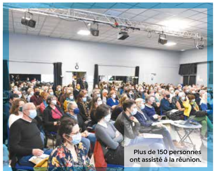
Plus de 150 personnes ont assisté à la réunion.

La réunion publique du secteur Carnot-Strasbourg a eu lieu le 9 mars. Elle faisait suite au Dimanche de respiration sur le boulevard de Strasbourg qui a recueilli de nombreux témoignages positifs. Poursuivant les objectifs d'apaiser le quartier, de protéger le commerce local et de préserver la vie sociale, la Ville a présenté de grandes orientations, dont la mise à double sens des boulevards Rabelais et d'Orient dès cet été. La finalité étant de réduire la circulation vers la place Carnot, de réaménager le boulevard de Strasbourg et de rendre l'itinéraire automobile des boulevards périphériques plus lisible au sud du centre-ville. « Les réflexions pour l'amélioration urbaine du quartier seront partagées. C'est le sens de la démarche qui s'engage pour vous », a précisé Michaël Delafosse, le maire. La parole est aux habitants sur la plateforme participative jusqu'au 9 mai. participer.montpellier.fr