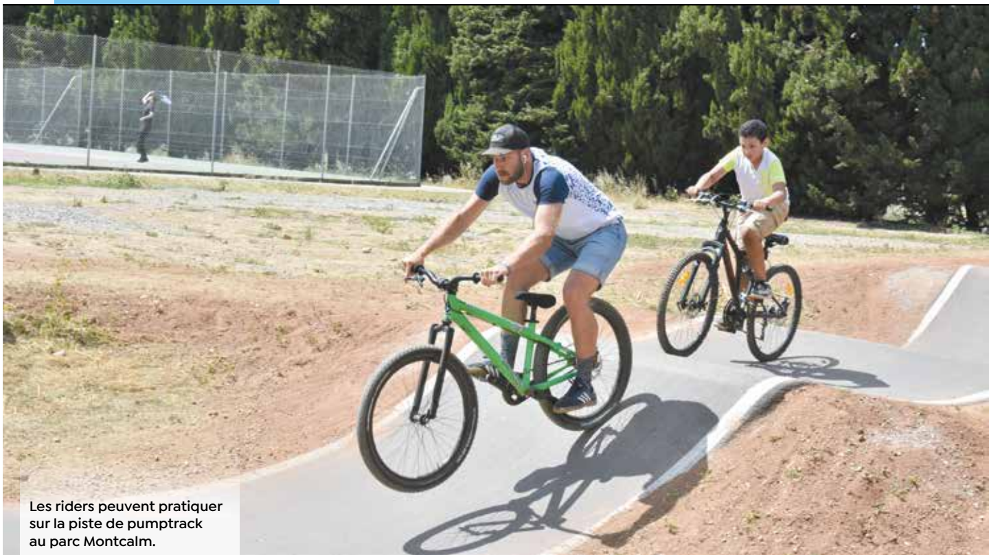
Les riders peuvent pratiquer sur la piste de pumptrack au parc Montcalm.