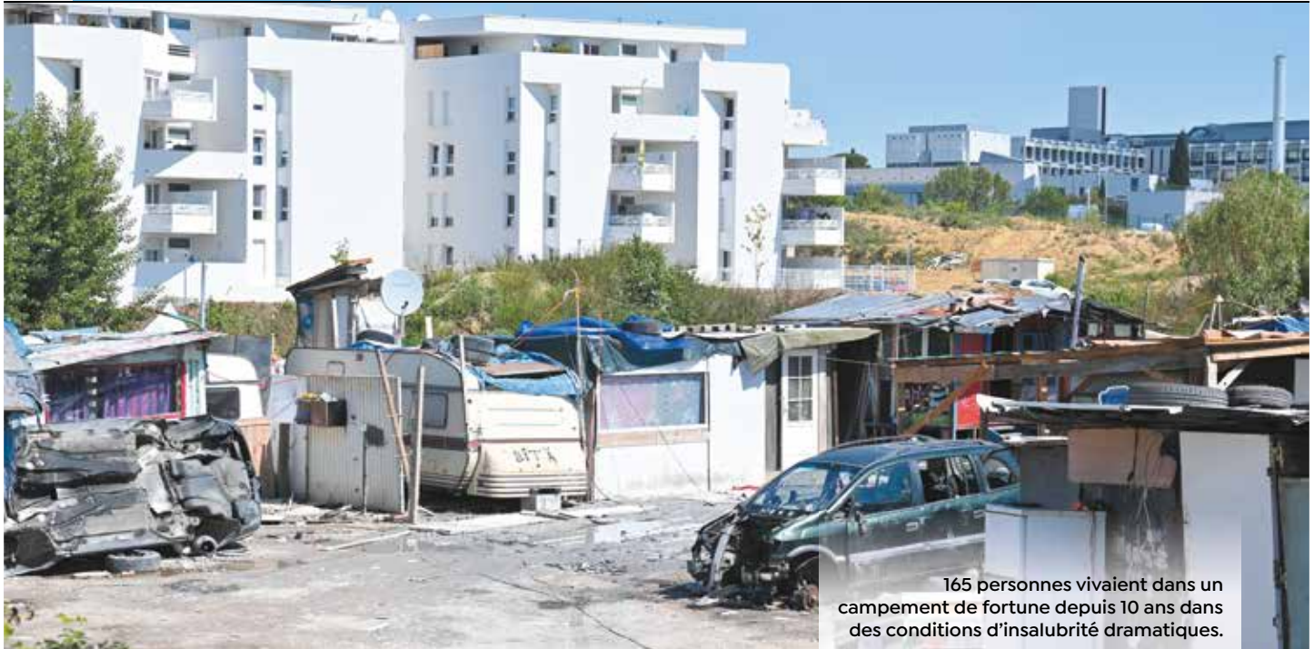
165 personnes vivaient dans un campement de fortune depuis 10 ans dans des conditions d'insalubrité dramatiques.