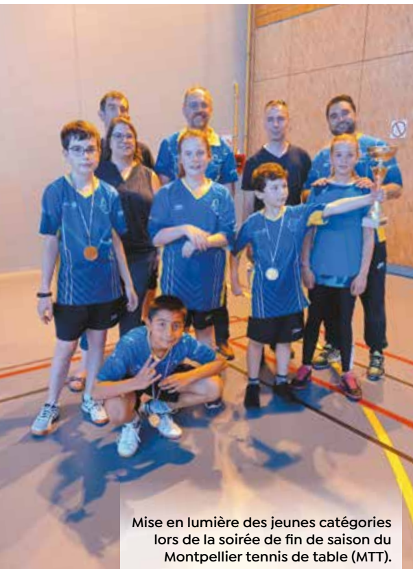
Mise en lumière des jeunes catégories lors de la soirée de fin de saison du Montpellier tennis de table (MTT).

au rugby. J'interviens également dans les quartiers à la rencontre des jeunes. Ce sport est accessible, vous avez votre place, osez vous lancer ! Voilà mon message », confie celle qui suit un DU de manager de club sportif à la faculté de Limoges. Par cet engagement, elle prône les valeurs du rugby : le respect, la tolérance, la patience, la détermination. Et grâce à sa formation d'éducatrice spécialisée, elle a les bons mots. « Avant de penser à la performance, pensez à vous amuser », clame-t-elle aux jeunes parmi lesquels, à ne pas douter, elle fait des émules.