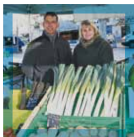
Représentant des commerçants du marché Plan Cabanes

« Nous sommes, avec mon épouse, depuis plus de 40 ans sur le marché Plan Cabanes. Un marché, c'est les yeux et les oreilles de la ville. Actuellement, l'accessibilité est un point noir. Mais la piétonnisation est une bonne chose. La récupération de l'accès au parking souterrain est positive. Notre visibilité s'est accrue avec la ligne 3 de tramway, bien passante, qui amène du monde. Les gens nous connaissent. Ils viennent depuis Clapiers, Saint-Jean-de-Védas, Fabrègues... Nous sommes une dizaine de commerçants, 6 jours sur 7. On fait de la qualité, du local, de l'agriculture raisonnée, et on essaie de maintenir des prix pas trop élevés. »