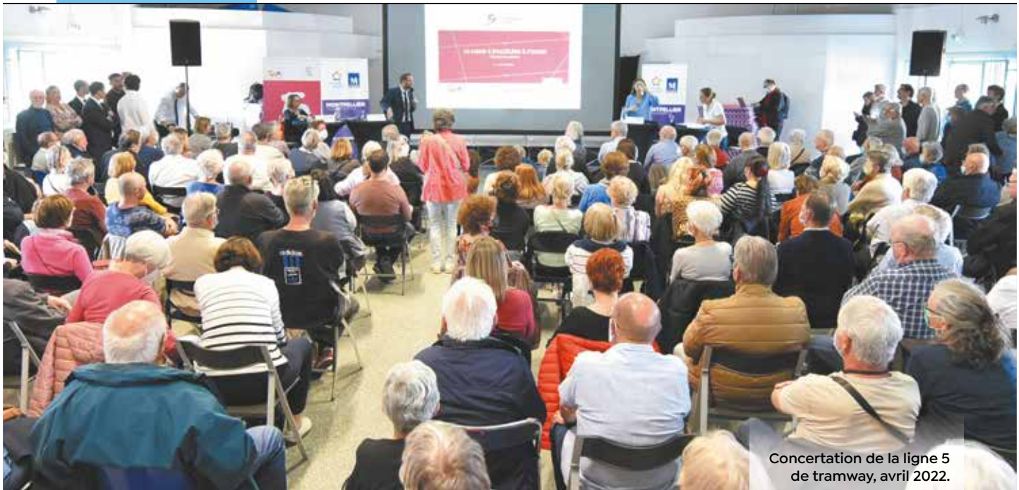
Concertation de la ligne 5 de tramway, avril 2022.