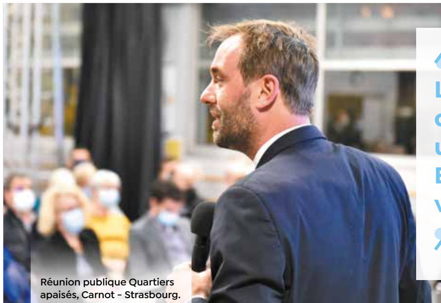
Réunion publique Quartiers apaisés, Carnot - Strasbourg.