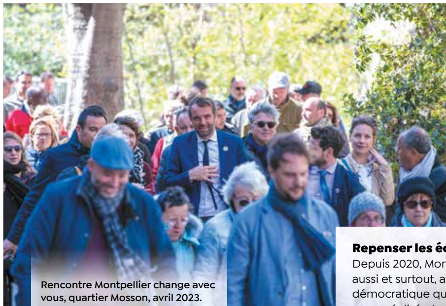
Rencontre Montpellier change avec vous, quartier Mosson, avril 2023.