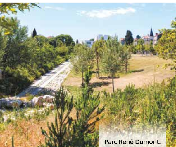
Parc René Dumont.

Jusqu'au 7 juillet, le Réseau des médiathèques propose un large choix de rendez-vous : bébés lecteurs, la projection du film Les Sorcières de l'Orient , Au fil du livre, un atelier couture, des soirées jeux de société ou fête de la musique... L'été rime avec danse et musique. Pina Bausch, Kader Attou ou Dalila Belaza embelliront le festival Montpellier danse du 20 juin au 4 juillet. La fête de la musique prévue au Peyrou, le 21 juin, promet un beau moment de réjouissances pour franchir le solstice d'été. La Fête nationale du 14 juillet et son traditionnel feu d'artifice prévu à 23h (voir p. 10), au parc Georges Charpak, seront un moment convivial de commémoration, un rassemblement joyeux et festif. Il sera possible de voir ou revoir les expositions de La Panacée, de l'espace Saint-Ravy, de l'espace Bagouet... Jardin des Plantes, parc Montcalm, parc Clemenceau, jardin de la Reine... Montpellier regorge d'espaces verts, de parcs, de jardins, d'un riche patrimoine végétal. Ils resteront ouverts (sauf en cas de risque d'incendie), et accueilleront celles et ceux qui souhaitent profiter de ces poumons verts indispensables en période de chaleur intense. Des espaces qui permettent la libre détente sans contrainte et procurent le plaisir de se mettre en lien avec la nature à portée de main qu'offre notre ville.