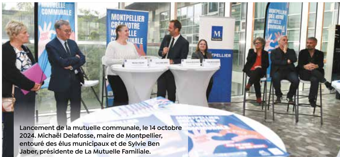
Lancement de la mutuelle communale, le 14 octobre 2024. Michaël Delafosse, maire de Montpellier, entouré des élus municipaux et de Sylvie Ben Jaber, présidente de La Mutuelle Familiale.

Mesure phare du bouclier social, la promesse d'une mutuelle communale proposée à tous les habitants et étudiants de Montpellier est désormais une réalité, impulsée par Michaël Delafosse et son équipe. Une mesure emblématique pour renforcer l'accès à la santé et améliorer le pouvoir d'achat.