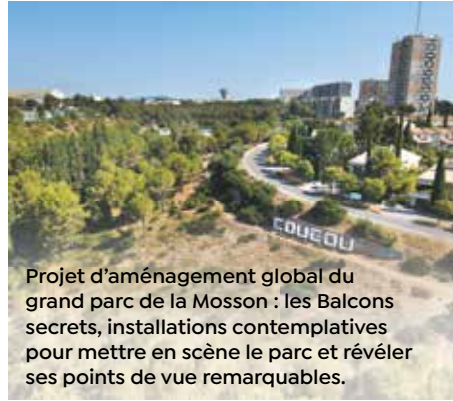
Projet d'aménagement global du grand parc de la Mosson : les Balcons secrets, installations contemplatives pour mettre en scène le parc et révéler ses points de vue remarquables.