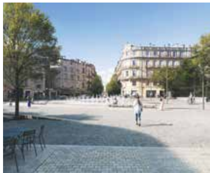
© Osty& Associés paysage et urbanisme

QUAND → La fin des travaux est prévue à l'automne 2025 avec une livraison le 26 novembre, date d'anniversaire de la ville et lancement des illuminations de Noël.